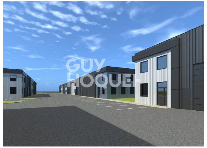
PROJET _ PLAN MASSE